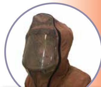
съёмный экран для защиты лица