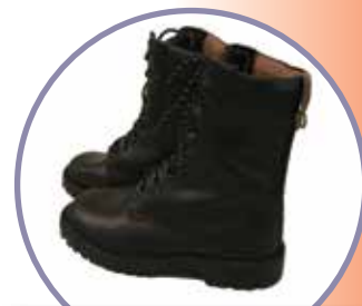
ботинки с электропроводящей подошвой